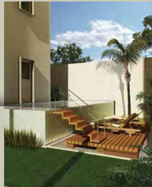
Juan Ruiz de Alarcón 221 Colonia Lafayette